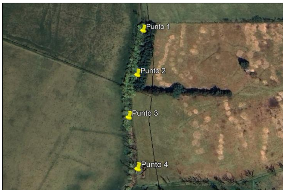
Ilustración 1. Recorrido de verificación ambiental- Ronda humedal Gualí

Con base en lo anterior, el día 02 de agosto se realizó recorrido de control y vigilancia en el humedal Gualí desde las coordenadas °4 47'7.701" N, 74° 12'59.546" W hasta las coordenadas °4 47'2.869" N, 74° 12'57.534" W (ver ilustración 1. Ruta amarilla) vereda El Cacique, ecosistema que fue declarado por la Corporación Autónoma Regional de Cundinamarca - CAR como Distrito Regional de Manejo Integrado a través del acuerdo 001 de 2014 "Por medio del cual se declaran como Distrito Regional de Manejo Integrado (DMI), los terrenos comprendidos por los humedales de Gualí, Tres Esquinas y Lagunas de Funzhé, y su área de influencia directa ubicada en los municipios de Funza, Mosquera y Tenjo, Cundinamarca", y estableció tres zonas: 1. Preservación (espejo de agua), 2. Recuperación (50 metros) y 3. Uso sostenible (100 metros).